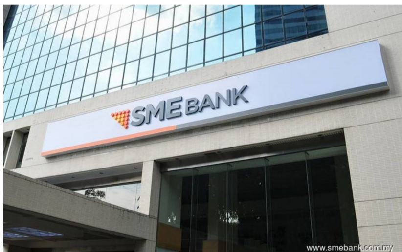
SME Bank: Inisiatif khusus bernilai RM900 juta bantu kembang perniagaan PKS