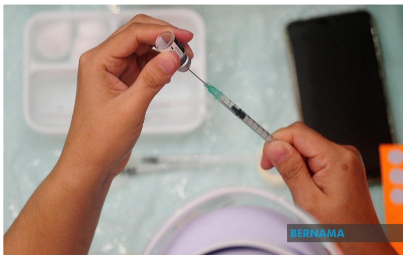
Picagari vaksin COVID di Malaysia mencukupi, peluang baik untuk pengeksport - Pembekal