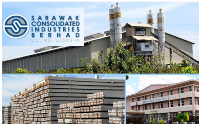
SCIB memeterai penyelesaian projek dengan pelanggan